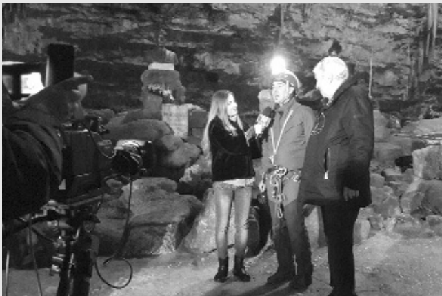
Un momento della diretta con Telenorba