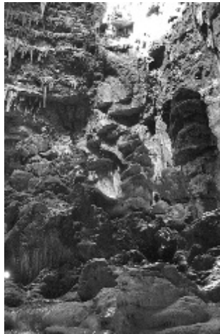
La discesa commemorativa